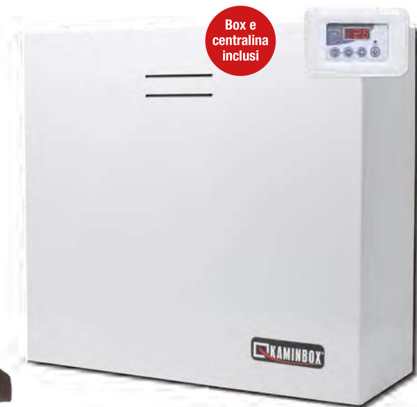
Dimensioni 15 x 44 x 34 cm (PxBxH)